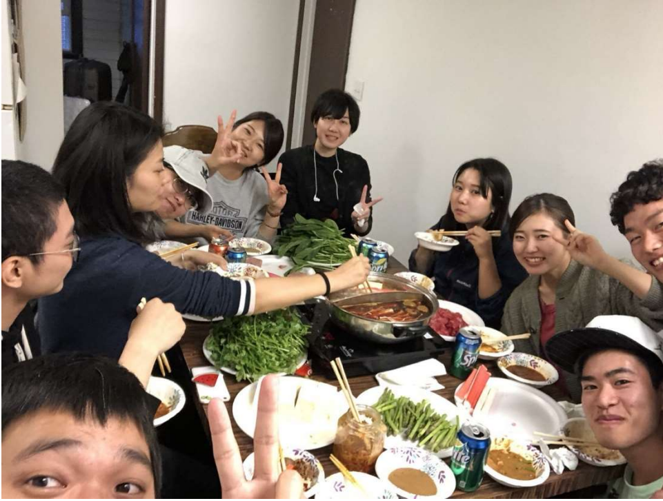
日本と中国と台湾の隣国同士の鍋パーティー。とにかく辛い。(笑)