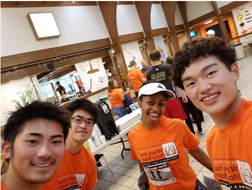
マラソン大会に参加しました。学生の中で4位でした。