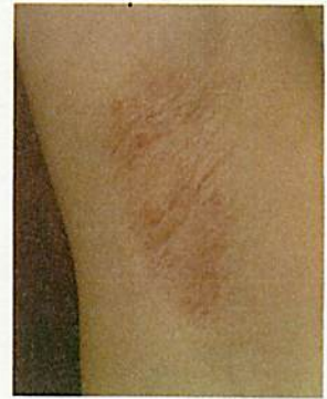
図2 脱毛後に色素沈着が残った例 (女性:わき)