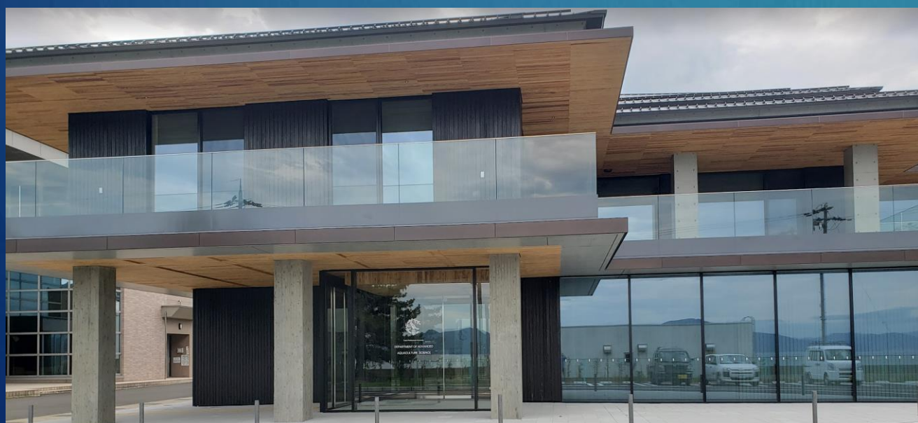
先端増養殖科学科 新学科棟