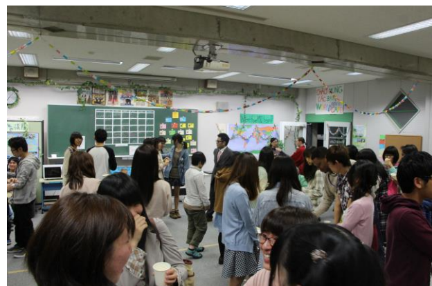
（4月24日のイベント「Easter Party」の様子）