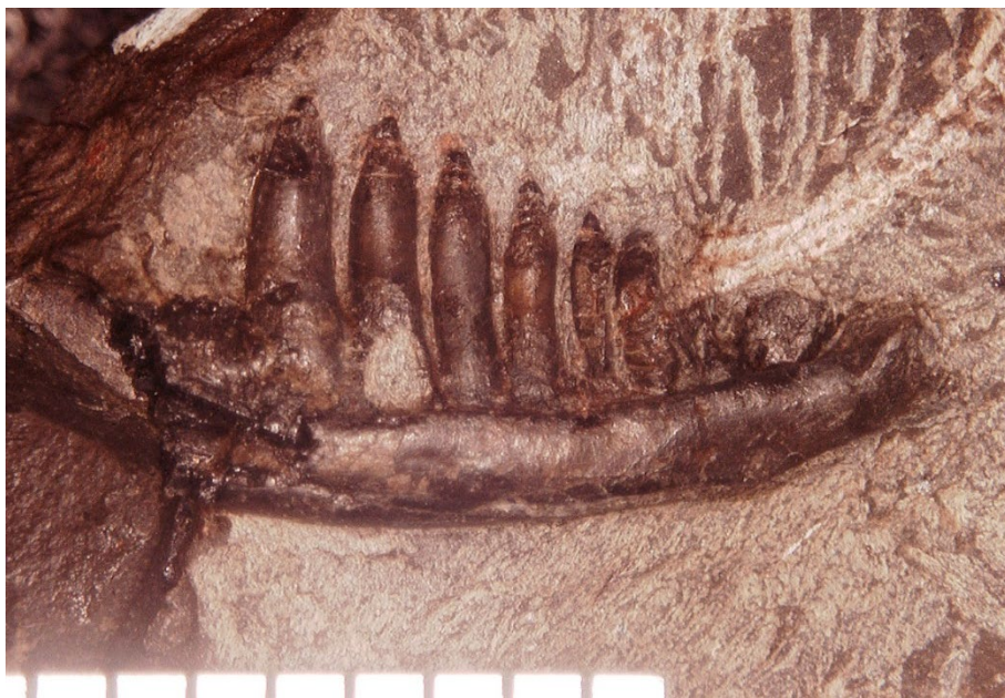
発見されたトカゲ類化石の左の下あご（左歯骨）